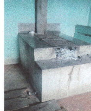
Foto 2: Sustitución plancha nueva rural, incluye chimenea y plancha de metal.